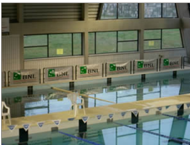
La piscina dove si sono svolte le gare circondata dai loghi BNL

La manifestazione ha avuto luogo a Livorno presso la piscina comunale La Bastia nei giorni 23 e 24 febbraio 2008. I campionati di nuoto Master Toscana hanno visto la partecipazione di circa 900 atleti (uomini e donne) tra i 25 e i 90 anni, provenienti di tutte le province della Toscana.