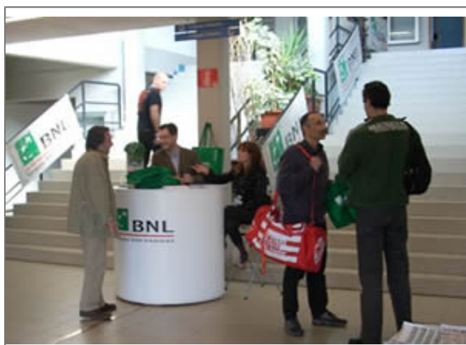
L'ingresso della manifestazione

Una sponsorizzazione sportiva per l'Area Toscana Ovest ed Est