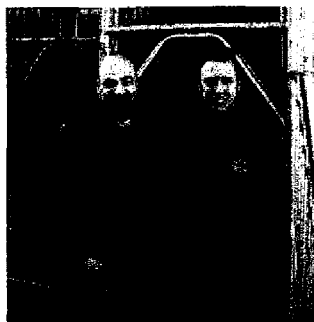
I titolari della Uguccione Ponteggi

La Uguccione Ponteggi opera da anni nel settore edile ed industriale con la sua ampia gamma di prodotti che vanno dal semplice puntello al ponteggio multidirezionale, alle piattaforme aeree. I servizi proposti si riferiscono al noleggio, alla vendita e alla prestazione di manodopera per il montaggio. I mercati di destinazione sono quelli del nord Italia e spaziano dal privato alla grande industria: l'Archivio di Stato di Milano,