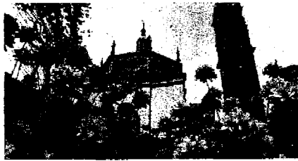
Piazza S. Maria in fiore

A Busto Arsizio si vive bene: lo hanno dichiarato gli stessi cittadini interpellati nei mesi scorsi dall'Istituto Piepoli. Il 70% considera infatti alta la qualità della vita in città. Si tratta di un dato superiore alla media nazionale che si spiega con il fatto che Busto offre tutte le opportunità di una grande città ma è ancora a misura d'uomo. Una città di cui, per dirla come Italo Calvino, "non godi le sette o le settantasette meraviglie, ma la risposta che dà a una tua domanda o la domanda che ti pone obbligandoti