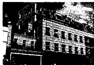
Progetto previsto in Vicolo Foscolo

Mentre tutti parlano di risparmio energetico, in centro a Busto Arsizio sta già diventando realtà un nuovo complesso residenziale con soluzioni rivoluzionarie che consentiranno ai futuri proprietari di riscaldare d'inverno e rinfrescare d'estate le loro abitazioni spendendo all'incirca solo un euro al giorno. A 100 mt dall'isola pedo-