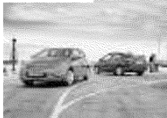
Insight, ibrida Honda costa 16.400 euro

VERONA. Continua a riscuotere successo in Italia la prima ibrida per tutti, Honda Insight. Sono quasi 3 mila i clienti che hanno scelto in soli tre mesi dal lancio, di essere innovativi rispettando l'ambiente. Perché giudicano questa vettura un prodotto dal prezzo contenuto e dai costi di gestione bassi.