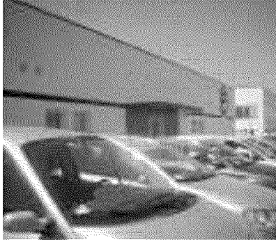
Un aspetto dell'outlet delle auto