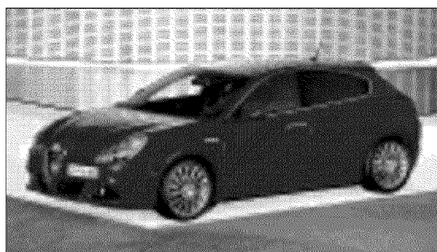
L'Alfa Romeo Giulietta è stata la più votata dai giornalisti