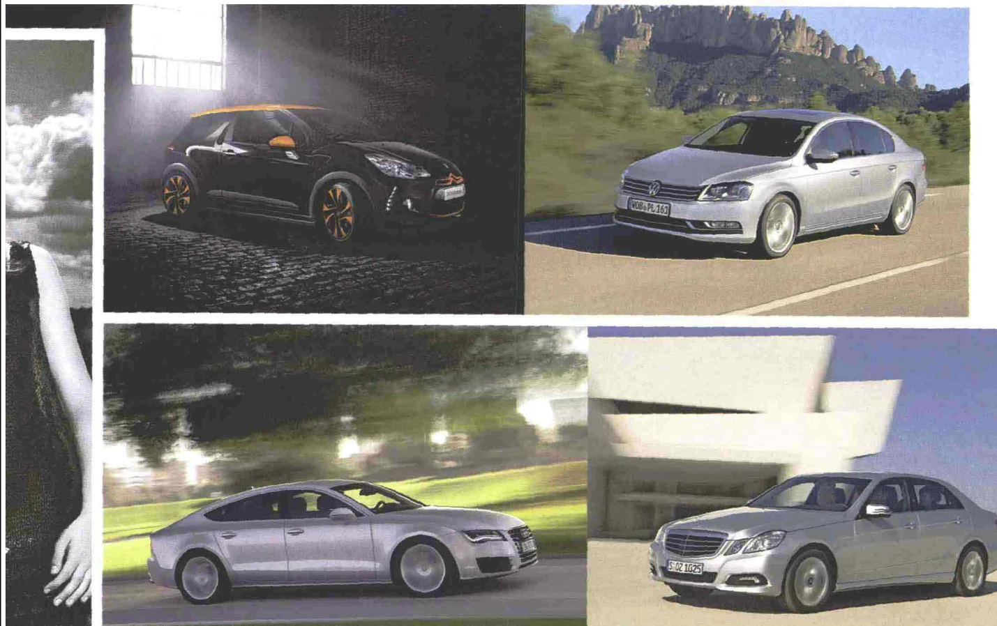
Dall'alto a sinistra, e procedendo in senso orario: la Citroën DS3 Racing; la nuova Passat; la Mercedes Classe E 200 NGT; l'Audi A7 Sportback