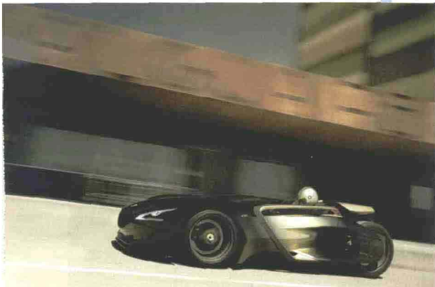
La Peugeot EX 1. A destra: Renault DeZir. In basso, da sinistra: la 500 in versione elettrica presentata da Micro-Vett; la Citroën C Zero

I prototipi si dividono in tre categorie: veicoli estremi, a rappresentare esercizi di stile ai limiti del futuribile; auto praticamente identiche a quelle già in commercio, ma con innovazioni tecniche che magari non verranno mai adottate; macchine che paiono vere e invece esibiscono soluzioni che appariranno domani sui vari modelli della marca che le mette in mostra. Al Motorshow ciascuna delle famiglie di concept-car è ben rappresentata. Alla prima s'iscrive l'aveniristica DeZir, coupé che sembra uscita da un fumetto giapponese e che è il biglietto da visita di Laurens van den Acker, nuovo responsabile stilistico della Renault. Coupé pieno di curve, con portiere che si aprono verso l'alto, monta ruote da 21 pollici, ha la carrozzeria in kevlar e il telaio in acciaio tubolare, il che gli consente di pesare appena 830 chili. A spingerlo è un motore elettrico accoppiato al Kers, il diabolico congegno che