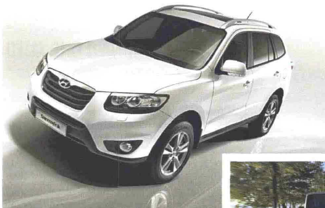
A sinistra: la Hyundai Santa Fe. Qui sotto: la Jeep Wrangler. In basso: Tazzari Zero